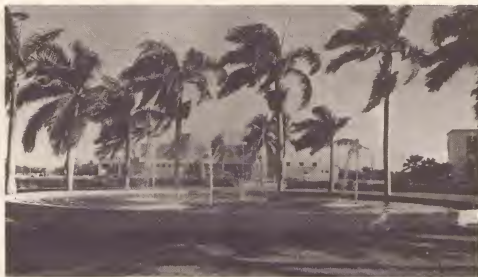
Aruba ta bira mas bunita cu fontein nobo.

Na interes di sanidad publico y pa vista di nos isla, gobierno a duna tur cooperacion na e comision 2000 di limpieza y tambe a inicia recientemente te un campaña di limpieza.